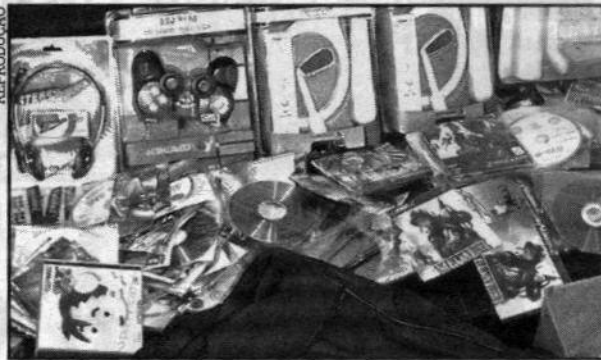
Os CDs e acessórios para videogames estavam em uma loja

Segundo informações do boletim de ocorrência, os policiais realizavam diligências para cumprimento de mandado judicial de combate à pirataria, quando apreenderam as mídias. O material foi encontrado atrás do balcão de uma loja, localizada na Avenida Thiago ferreira, em Vicente de Carvalho.