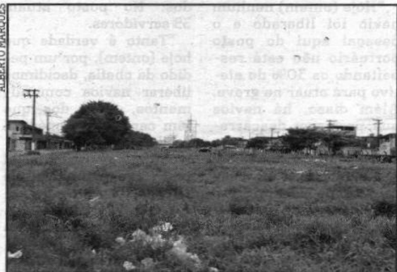
Remoção das torres em Vicente de Carvalho vai acabar em 2010