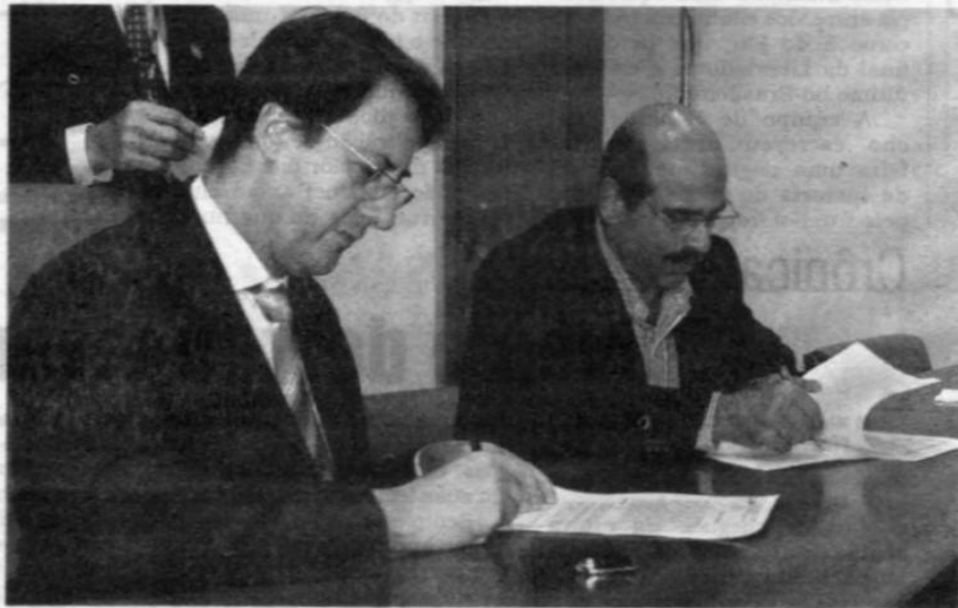
Codesp cedeu área do Linhão que corta Vicente de Carvalho para reurbanização e construção de moradias

No convênio firmado ontem, a Codesp cedeu um terreno próximo ao